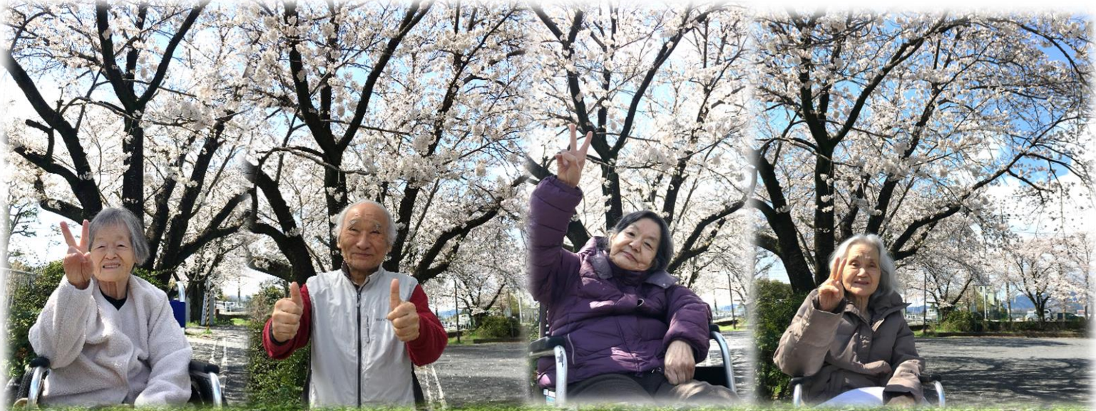
里見台まる山公園へ お花見

春和の候、皆様におかれましては益々ご健勝のこととお喜び申し上げます。また、日頃より当施設へのご理解、ご協力をいただき心より感謝申し上げます。今回のお便りは、お花見のご様子や新入職員の紹介、通所リハビリでの活動についてお伝えさせていただきます。今後とも、宜しくお願い致します。